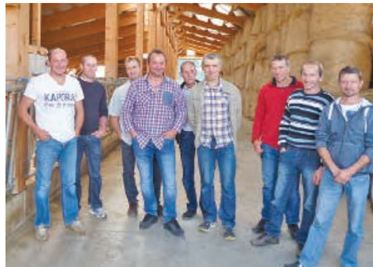
■ Le Ceta du Dessoubre en visite au Gaec du Pré Cassard.

L'après-midi, le groupe s'est rendu au Gaec du Pré Cassard au Béliou où les associés font égale-