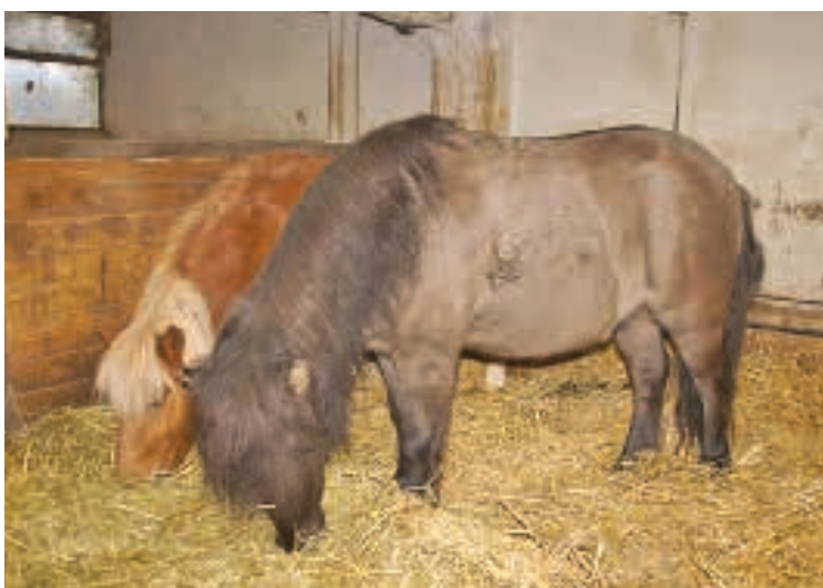
■ L'équitation est une activité appréciée par un jeune public.