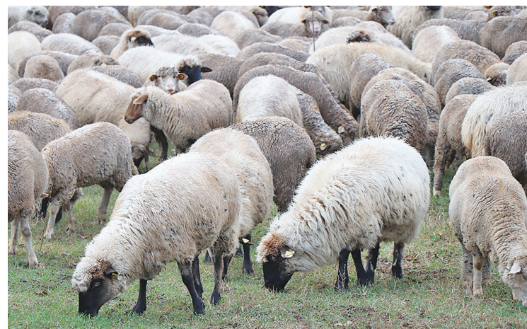
■ Diffuser les meilleures pratiques et les innovations reste un des principaux objectifs de SheepNet © Institut de l'Élevage.

SheepNet est un réseau sur la productivité ovine financé par l'Union européenne, qui implique les six principaux pays producteurs ovins de l'Union européenne (Irlande, France, Royaume-Uni, Roumanie, Espagne et Italie) et la Turquie. La productivité ovine (nombre d'agneaux élevés par brebis mise à la lutte) est une combinaison du succès de la reproduction, de la gestation et de la survie de l'agneau. C'est un des critères clés de la performance économique des élevages ovins. SheepNet est conçu pour stimuler l'échange de connaissances entre la recherche et les acteurs ovins (éleveurs, techniciens, vétérinaires,...) afin de diffuser largement les meilleures pratiques et les innovations, dans le but d'augmenter la productivité ovine. Le site web SheepNet ( www.sheepnet.network ) permet d'accéder aux solutions proposées et sera mis à jour régulièrement. Vous avez aussi des trucs et astuces et des bonnes pratiques intéressantes à partager dans le cadre de Sheep-